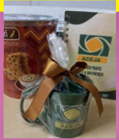
Brinde para os patrocinadores