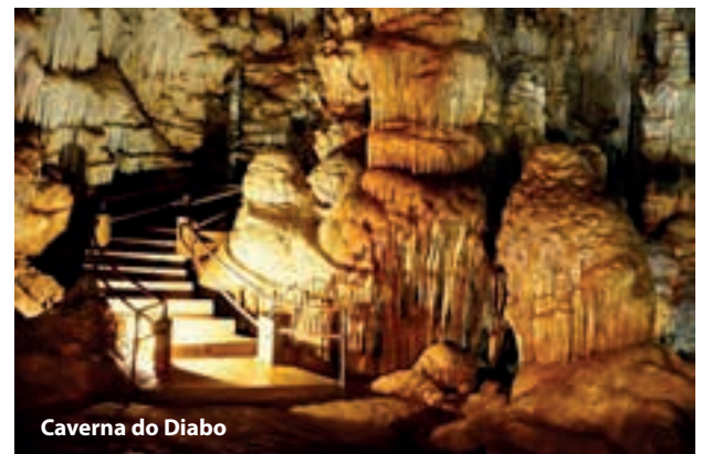
Caverna do Diabo